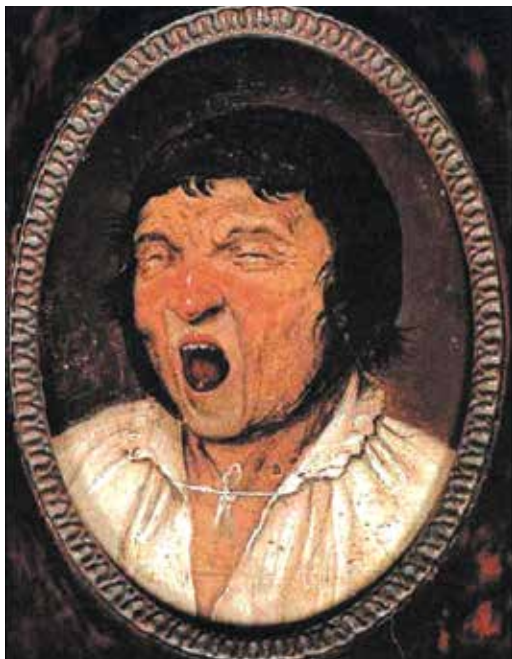
Рис. 1. Картина «Зевака», Питер Брейгель Старший, 1563 г. Fig. 1. "Yawning Man", Pieter Bruegel de Oude, 1563.

Типичные проявления БС – зажмуривание или усиленное моргание. Но в дебюте заболевания пациенты могут жаловаться на неприятные ощущения раздражения, инородного тела, зуда, сухости в глазах, а также на частое моргание [6]. В дебюте БС выраженность двигательных нарушений может быть асимметрична (например, один глаз зажмуривается в большей степени, чем другой), но всегда вовлекаются оба глаза.