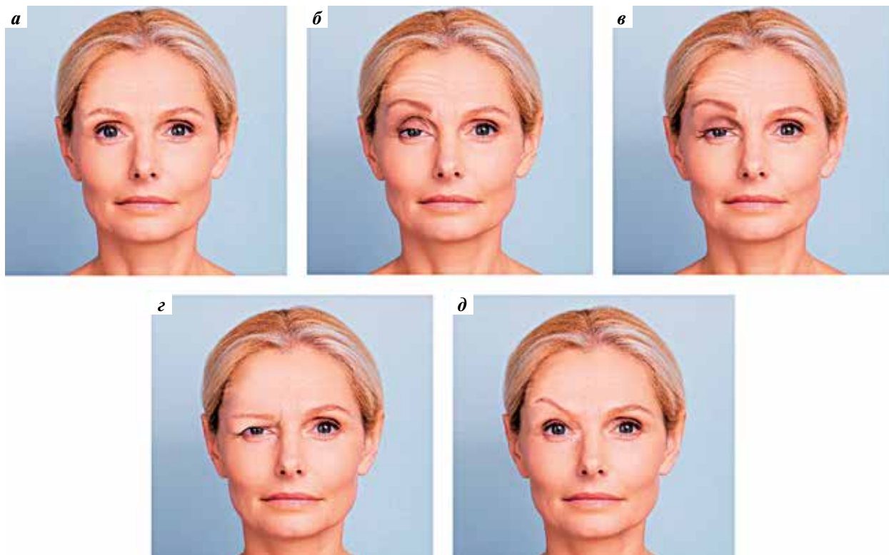
Рис. 3. Птоз, различные варианты: а — отсутствие птоза; б — птоз века с компенсаторной избыточной активностью лобной мышцы; в — псевдоптоз; г — опущение (птоз) брови; д — медиальный птоз брови с компенсаторным поднятием наружной части брови

Среди множества НЯ ботулинотерапии (см. таблицу) наибольшее беспокойство пациентов и врачей вызывает развитие птоза [15]. Этим термином могут обозначаться состояния, вызываемые различными причинами, с отличающимися подходами к лечению и профилактике (рис. 3).